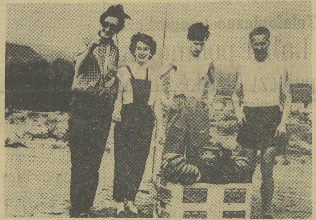
Los balonu „Maly Swiat” i jego 4-osobowej załogi jest nadal niezmany. Na zdjęciu: załoga balonu „Maly Swiat”