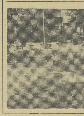
Część Plant od ul. Siennej do Mikołajskiej jest obecnie niedostępna dla mieszkańców naszego miasta. Powodem tego są prowadzone (na zdjęciu) prace przy zakładaniu trwałej nawierzchni.

W związku z wykryciem nowych ognisk stonki ziemniaczanej w uprawach w naszym mieście, Prezydium MRN — Miejski Zarząd Rolnictwa, na polecenie Prezydium WRN, zarządził, iż 20 bm. w godz. od 8 do 15 odbędzie się na terenie Krakowa i Nowej Huty obowiązkowe poszukiwanie tego szkodnika. W wypadku niepogody, poszukiwania odbędą się 21 bm. w tych samych godzinach.