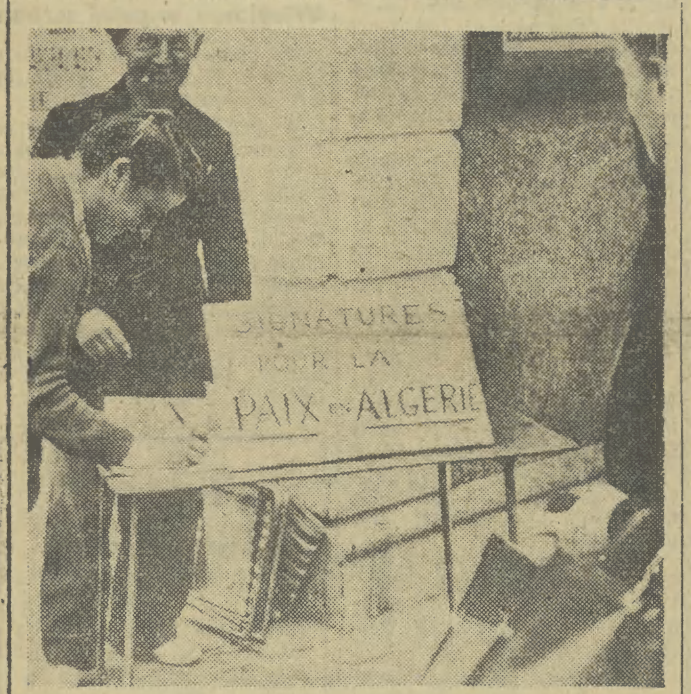
W całej Francji wzrasta liczba podpisów pod apelem o zaprzestanie wojny w Algierze.

Poborowi i ponadkontyngentowi, którzy przystąpią do pracy w górnictwie węglowym, zapewnione zostaną za- kwaterowanie w domach gór- nika w wypadku, gdy odległość od stałego miejsca zamieszkania uniemożliwia codziennie dojazd do pracy. Korzystać oni będą z odpłatnego wyżywienia w domach gór- nika oraz otrzymywać na własność ubrania i buty robocze na dogodnych warunkach opłaty ratalnej. Oprócz normalnego wynagrodzenia po sześciu miesiącach nienagan-