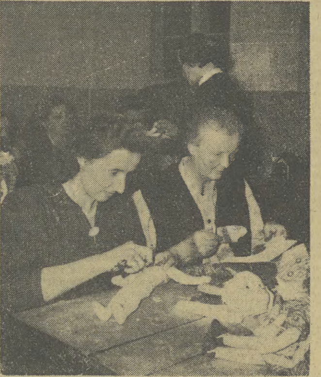
Referat Pracy Kobiet przy Powszechnej Spółdzielni Spożywców w Zakopanem zorganizował 36-godzinny kurs pierwszego stopnia przygotowujący kobiety do chrześcijańskiego wyrobu lalek...