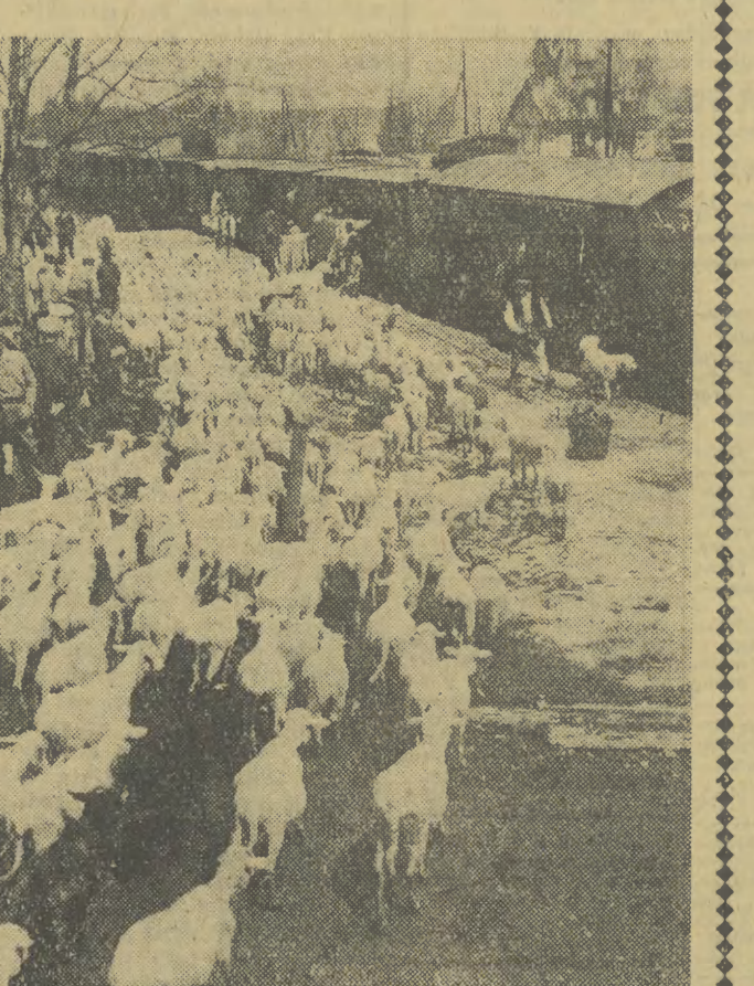
Za chwilę kierdel owiec z Białego Dunajca „zajmie miejsca” w oczekujących wagonach. Bacia Juhasi a nawet kudłate owczarki zagają niesfornych „pasażerów” do pociągu.

32 wagony załadowane, a w nich ponad 2000 owiec, siano na drogę, wozy, najpotrzebniejszy sprzęt. Za chwilę pierwszy transport ruszy w drogę, by następnie dnia rano stanąć na gościnnej, bogatej w soczystą trawę ziemi rzeszowskiej. Słowa pożegnania mieszają się co śpiewem juhasów,