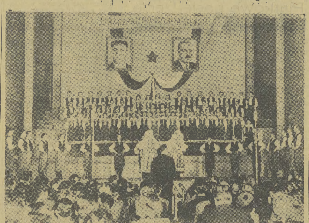
Każdy występ Państwowego Zespołu Pieśni i Tańca „Mazowsze” w Bułgarii wywoływał olbrzymią falę zainteresowania. Na zdjęciu: występ zespołu.