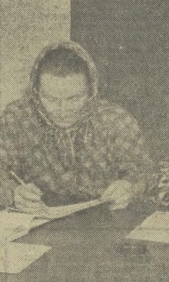
Robotnicy Zespołu Spółdzielcy „Jutrzenka” w Boleszynie w pow. Chrzanów...