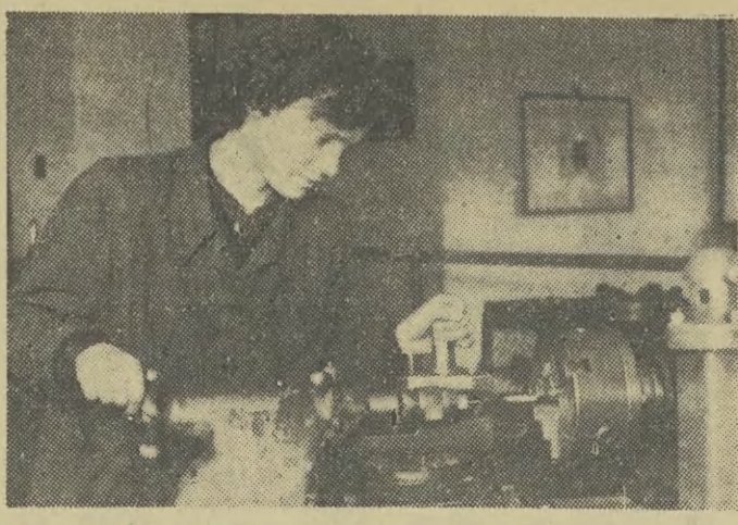
Coraz więcej dziewcząt kształci się w szkołach mechanicznych i metalowych. Na zdjęciu: jedna z uczennic w szkolnych warsztatach.