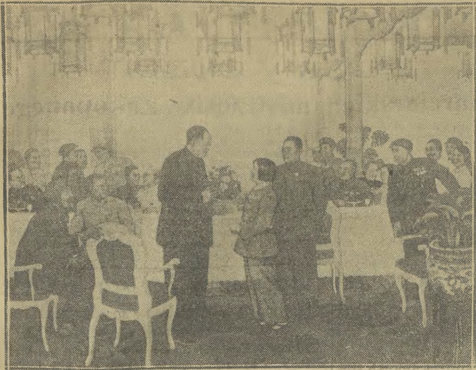
W sali Klubu Międzynarodowej Prasy i Książki w Warszawie otwarta została „Wystawa chińskich obrazów nowocześniejszych”. Wystawa zawiera 76 barwnych reprodukcji obrazów wybitnych współczesnych artystów chińskich. Na zdjęciu: „Czao Czui-lan na zebraniu bohaterów pracy”. Autor Lin Han.