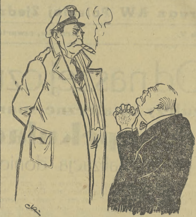
— Niech mnie pan puści...! — A po co pan jedzie do Stanów Zjednoczonych? — Chcę sprzedać resztki W. Brytanii.

Centralna Koreańska Agencja Telegraficzna donosi o trwających barbarzyńskich nalotach Amerykanów na miasta wybrzeża wschodniego. Szczególnie zaciekle był nalot bombardowców amerykańskich na miasto Hamhyn. Piraci powietrzni zrzucają dziesiątki bomb na podmiejskie plac targowe, a następnie ostrzelali z broni pokładowej usiłując się ratować kobiety i dzieci. Nalot został dokonany w południe, tj. w okresie kiedy na placach targowych Hamhynu znajduje się największe zgromadzenie ludności. Zginęło 68 osób, a przeszło 40 osób odniosło ciężkie rany. Zburzono i spalono przeszło 50 domów mieszkalnych.