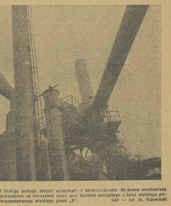
Huta „Rościuszko” w ramach Planu 6-letniego podlega dalszej rozbudowie i unowocześnieniu...