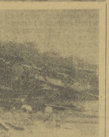
Szczątki pociągu, wykolejonego przez oddział AL między Szoską a Jęzorem...