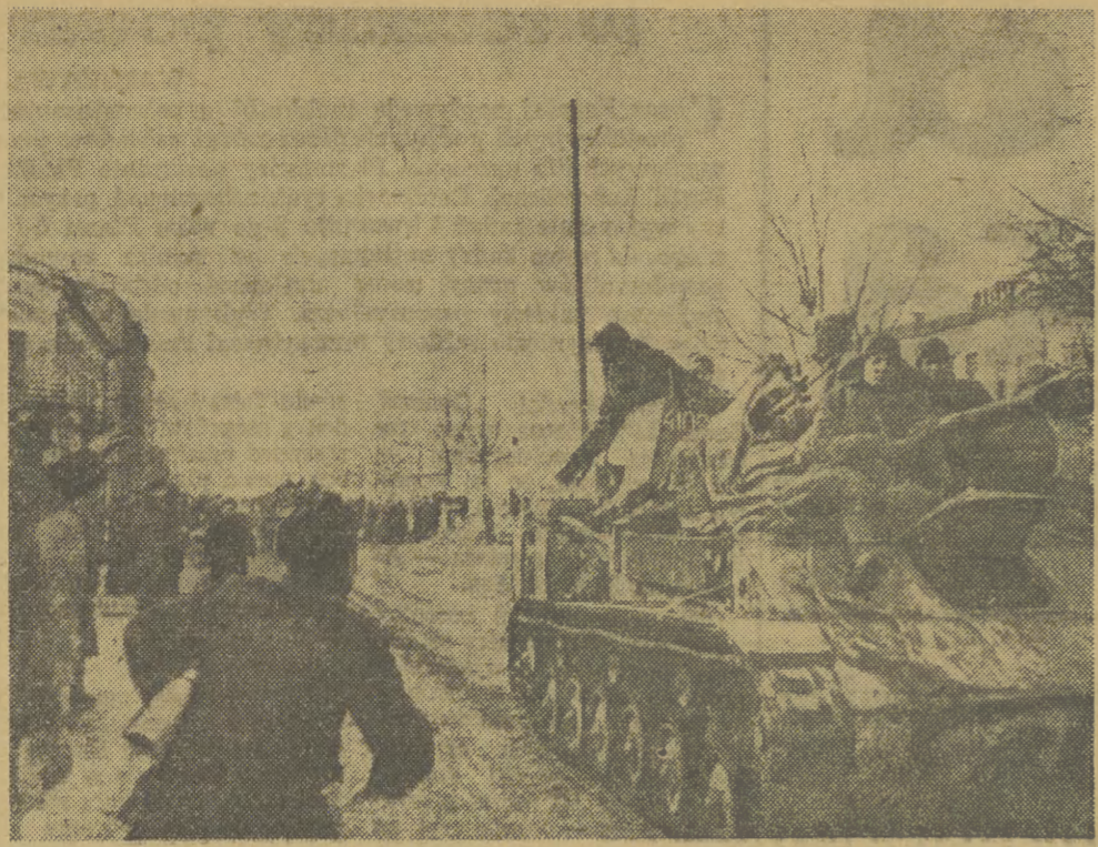
Błyskawiczna ofensywa zimowa Armii Radzieckiej w 1945 r. przyniosła nam wolność. Mieszkańcy wyzwolonych miast i wsi z radością i wdzięcznością witali bohaterów Armii Wyzwolicieli.