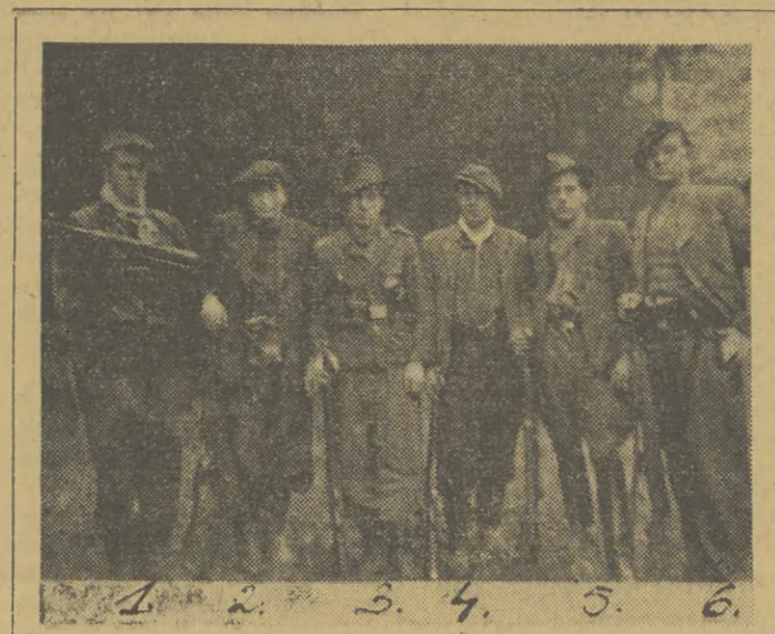
Grupa członków oddziału partyzanckiego im. J. Dąbrowskiego...