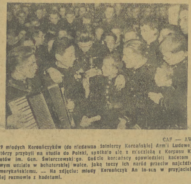
19 młodych Koreańczyków (do niedawna żołnierzy Koreańskiej Armii Ludowej), którzy przybyli na studia do Polski...