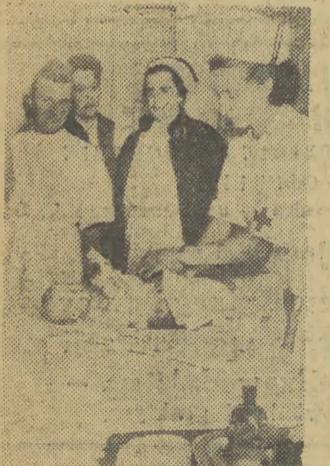
W sali pokazowej PCH urządzono wystawę obrządzoną higieniczne wychowanie dziecka. Na zdjęciu pielęgniarka przewija celulozowe niemowlę.