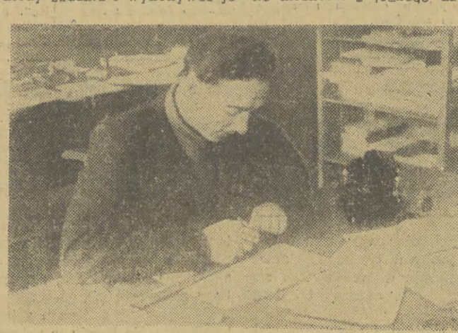
Praktykantka Zb. Fok, z Liceum Administracyjno-Handlowego