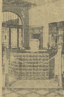
Jednym z najbardziej nowoczesnych zdrojowisk w woj. śląskim jest Polanica Zdrój, przepięknie położona, posiada doskonale wyposażenie lecznicze.