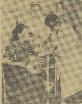
Warszawa ma 9 poradni lekarskich dla kobiet ciężarnych przy Ośrodkach Zdrowia. Pobieranie krwi do zbadania w poradni Ośrodka Zdrowia.