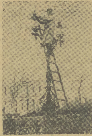
Zakładanie kloszy do zabytkowych latarni przed pomnikiem Mickiewicza w Warszawie.