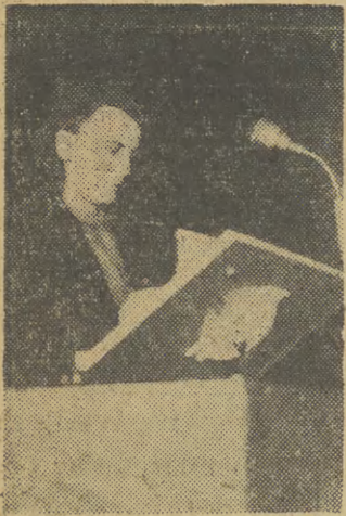
W Poznaniu odbyła się uroczystość przemianowania Zakładów Przemysłu Metalowego im. J. Stalina...