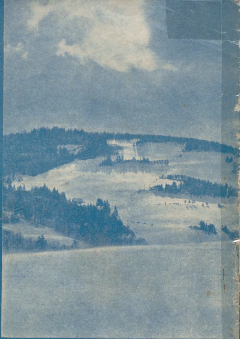
WIDOK ZE SKOCZNI NA GRZEBIENIU