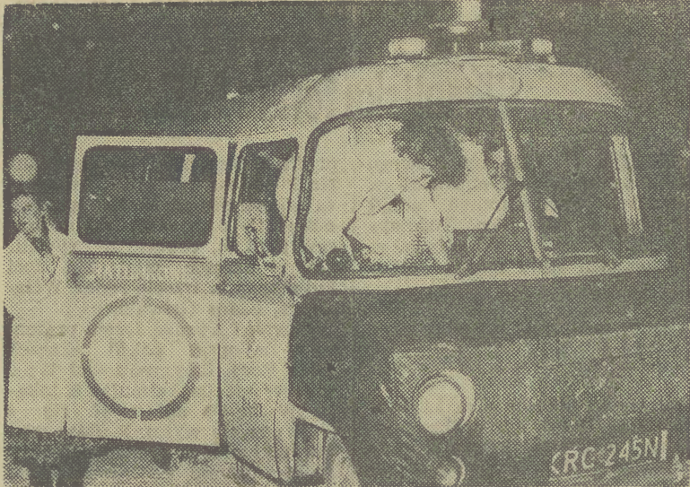
To kolejna sylwestrowa noc na dyżurze...

I tak zaczął się nowy rok — pracownicy dla motorniczych i kierowców pustych o tej porze tramwajów i autobusów, kierowców polewaczki, śnieżnego plugu, w nastroju beztroskiej zabawy dla innych. Oby był dobry dla wszystkich. (J.R.)