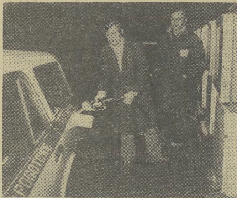
Ostatni klient stacji CPN obsługiwany był przez szefa...