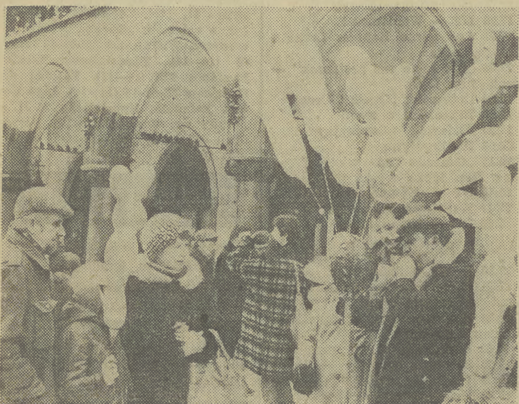
Sylwestrowy balonik dla dziecka czy ukochanej kobiety...

Baza Pomocy Drogowej PZM przy ul. Kawiorów tel. 37-55-75 świadczy usługi w dni powszednie w godz. 7-22 a w niedziele i święta od 10 do 18. Natomiast w Nowej Hucie, Al. Planu 6-letniego 154, tel. 44-16-32 i 44-17-60 tylko w dni powszednie od godz. 7 do 15.