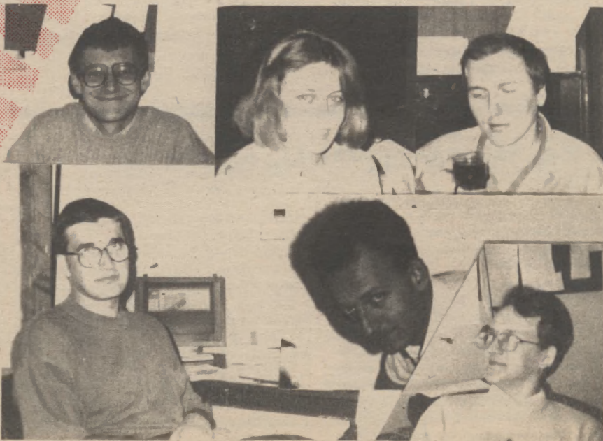
Pracownicy redakcji - niestety nie wszyscy.