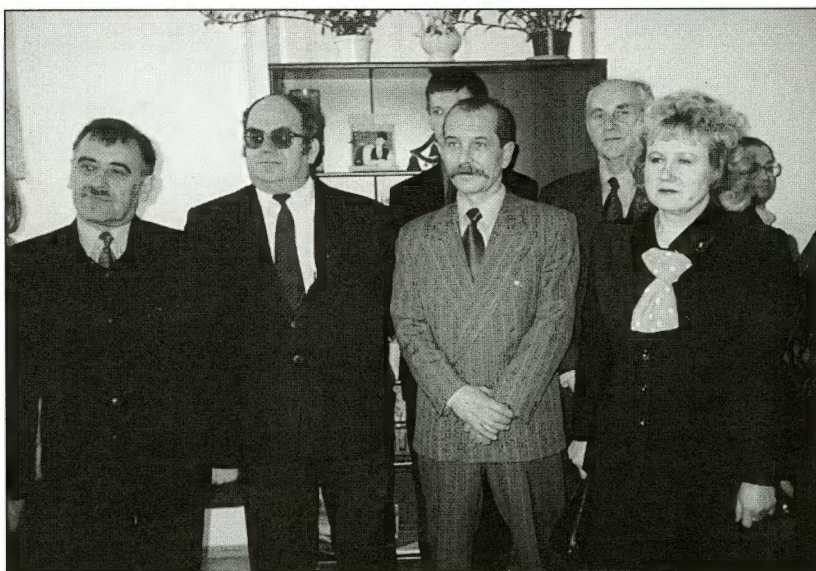
Goście podczas spotkania