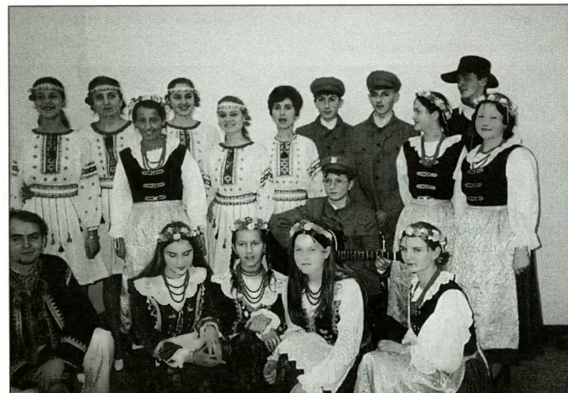
Trzy zespoły uczestniczące w uroczystości otwarcia Centrum: PIDGIRIANKA, OLEŚNIANKA i Legioniści z koleżankami z Gimnazjum w Bydlinie