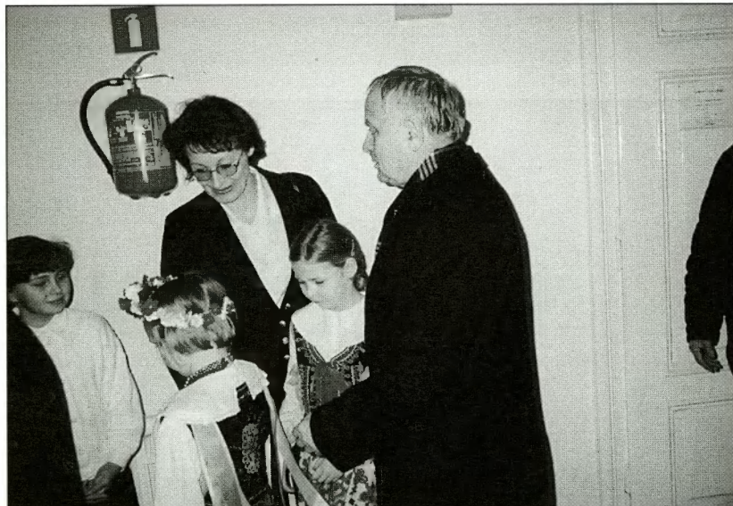
Pani Dyrektor i dzieci ze Szkoły Podstawowej w Rodakach rozmawiają z Ambasadorem Ukrainy