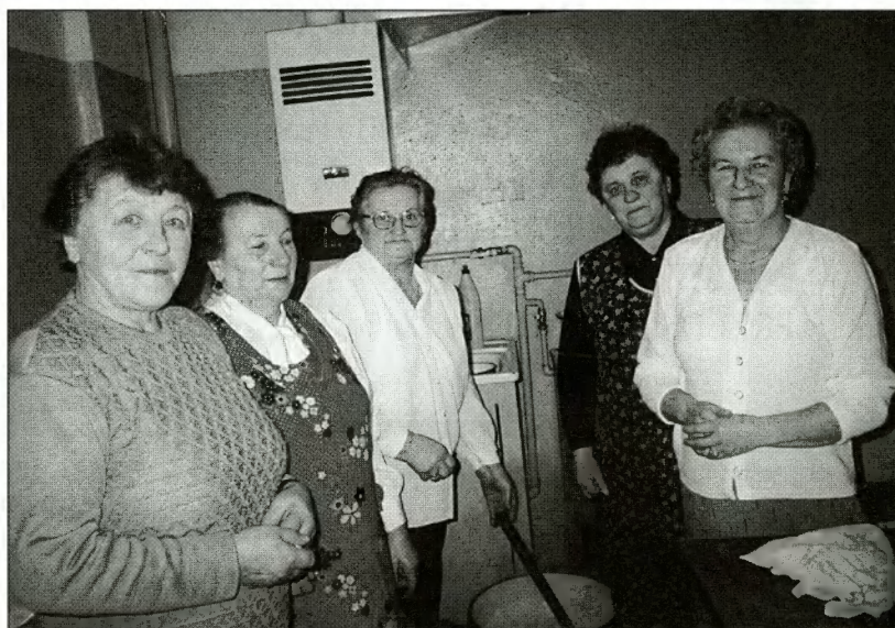
Kucharki przygotowujące pyszne dania