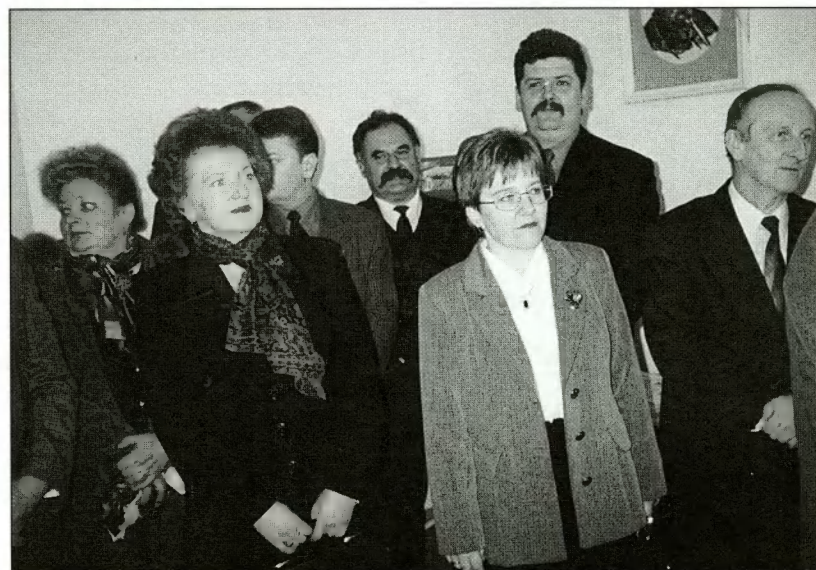
Goście podczas spotkania