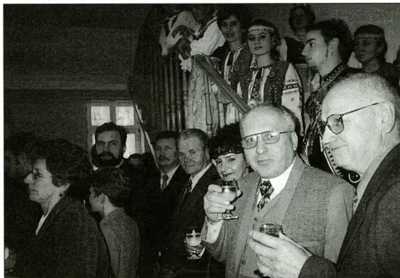
Goście podczas spotkania